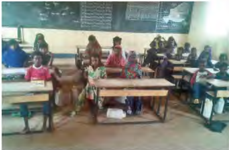
Une classe / een klas