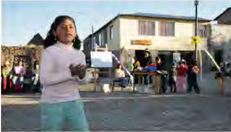
Notre maison/ons huis Wawamarka à/te Chucuito

villégiature pour citadins. Mais la zone de l'Altiplano reste une des régions les plus pauvres du pays avec, comme activités, une agriculture de subsistance, le tourisme, la contrebande (proche de la frontière avec la Bolivie) et pour beaucoup de jeunes le travail dans les grandes mines du département ou des départements voisins, le petit trafic de drogue et la délinquance liée au tourisme. Une majorité de chômeurs. Les taux de prévalence, de sévérité de violence, de désintégration intrafamiliale, d'alcoolisme et d'autres problèmes psychosociaux sont élevés.