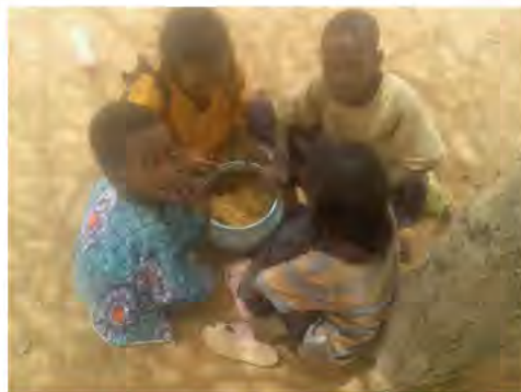
Repas à l'africaine / afrikaanse maaltijd