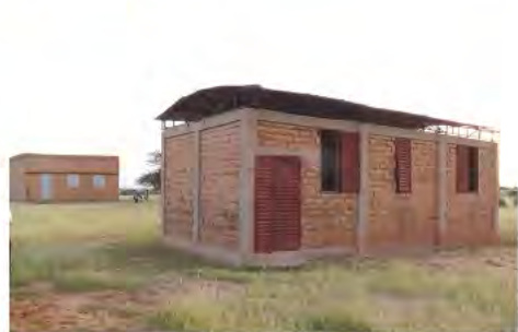
Ecole d'Adjangafa / school van Adjangafa