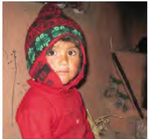
Enfants vulnérables/kwetsbare kinderen