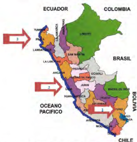
Bénéficiaire du projet /Maken gebruik van het project

Alumnos del Peru heeft 4 nederzettingen in het land al naargelang de noden die er zijn: een eerste in Chucuito-Puno, een tweede in Nana-Lima in een "pueblo joven" (sloppenwijk), en, sinds april 2016, een derde in Ichu-Puno en vanaf 2017 een vierde in Piura. Deze 4 structuren hebben dezelfde objectieven maar worden geleid door onafhankelijke teams.